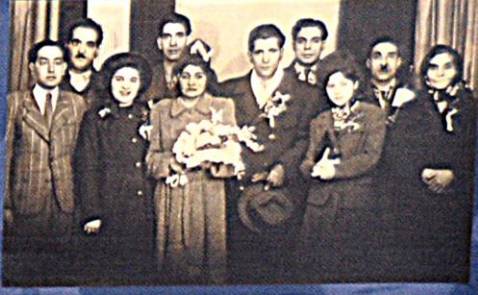
Srouba v rodině integrovaných moravských Romů Blatná, 1940