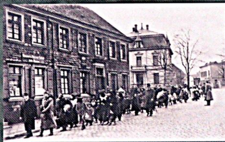
Deportace Romů a Sintů z Německa do Osvětimi, Ramscheid, 1943

První hromadný transport „cikánů“ dorazil do koncentračního tábora v Osvětimi II-Březince (něm. Auschwitz II-Birkenau) z Německa 26. února 1943, kdy zdejší tzv. cikánský tábor nebyl ještě zcela dokončen. Během několika dalších týdnů sem bylo dopraveno přes 10 000 Romů a Sintů z celé Evropy a nově zřízený „cikánský“ tábor byl již přeplněn. V „cikánském“ táboře v Osvětimi byli Romové a Sintové z Německa nejpočetnější skupinou vězňů. Za druhé světové války bylo vyraženo více než 15 000 německých Romů a Sintů.