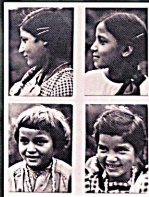
„Cikánské“ děti z Dětského domova sv. Josefa v Mullingenu