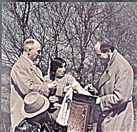
Němečtí rozsvětlení odebírají krev „cikánské“ ženě, 1936–1940