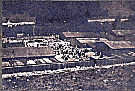
CT Hodonín, vězňové při vycházce; v plotu jsou odstaveny kořavné vozy (maringotky).

Výňatek z Domácího řádu CT Lety, který platil do 30. 9. 1942.