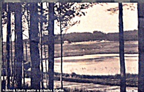
Rybník Lipěže, v pozadí u lesa „cikánský“ tábor Lety