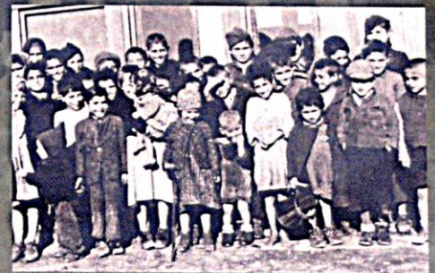
Dětišti vězňové „cikánského“ tábora v Letech

Švečko jsem tam pohřbila, můj syn tam umřel... umřel, nebo to děvčisko (táborová ošatřovatelka), ona to dítě vyřihla z vás jako psa... Až za dva tři dny mi tam potom ten chlapecak umřel... (Žena již zůstala bezdětná.) (E. D., *1924, CT Hodonín)