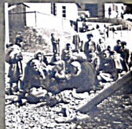
CT Hodonín, ženy a děti v přestávce na jídlo

Ty kameny byly moc těžký, ještě teď mám na noze, jak mi na ni jeden spadl. Tam dělaly i ženské s malýma dětma na zádech, měly kladiva, musely to tlouct, děti na zádech, a ty ženské, když slunko svítlo na nich, tak usínaly, a tak je bili po hlavách s týma pentekama, hrozný... (M. K., *1927, CT Hodonín)