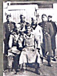
CT Lety, četnický personál s vězňi – pracovníci táborové kuchyně