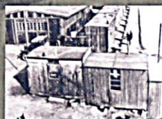
CT Lety, 1942–1943