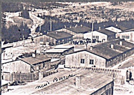
Hodonín, „ghettný“ tábor, 1942

Počet vězňů brzy mnohonásobně převýšil kapacitu obou táborev. A to i přesto, že se postupně dostavovaly další baráky a využívalo se i odstavených maringotek, kterými někteří Romové do tábora přijeli. Podmínky života v neizolovaných přelidněných dřevěných baráčkách se staly neúnosnými zvláště po nástupu zimy.