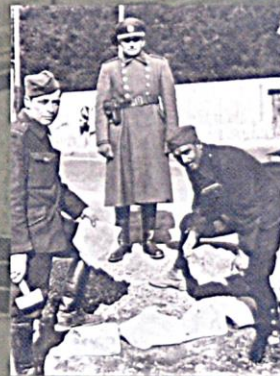
CT Lety, vězňové demonstrují práci pod dozorem četníka

Dělali jsme přes les takový cestu. Tam jsme museli kopat s krompáčema a jezdit s vozíčkama. Planý rovali jsme to. Chlapi, ženské, děti, všechno dohromady. (A. B., *1924, CT Hodonín)