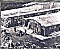
CT Hodonín, přístavba nových baráček, zima – jaro 1943

Ty baráky to byly takový dřevěný buniky, na seknci nás bylo osm až deset lidí, postele nad sebou. (B. B., *1928, CT Lety)